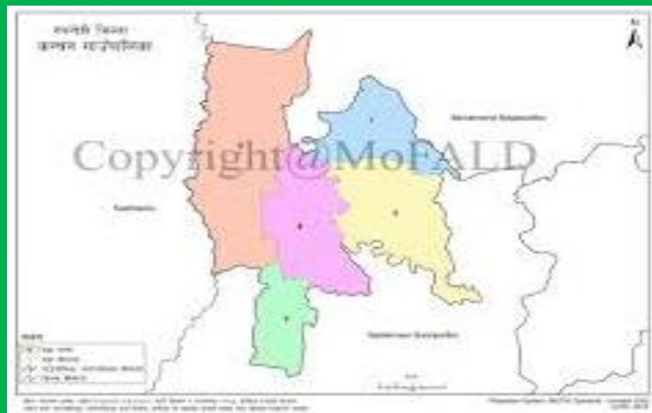
चित्र नं.२.कञ्चन गाउँपालिकाको नक्सा