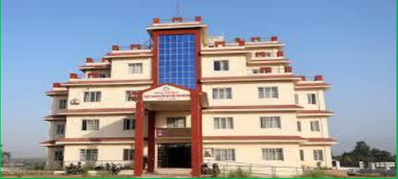
गाउँपालिकाको प्रशासकीय भवन